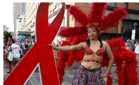
Участник парада, Манила (Филиппины) 1 декабря 2015 года

Впервые его отметили 1-го декабря 1988 года после того, как на встрече министров здравоохранения всех стран прозвучал призыв к социальной терпимости и расширению обмена информацией по ВИЧ/СПИДу. Ежегодно отмечаемый 1-го декабря, Всемирный день служит делу укрепления организационных усилий по борьбе с пандемией ВИЧ-инфекции и СПИДа, распростра-